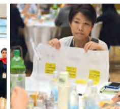
COREA DEL SUR